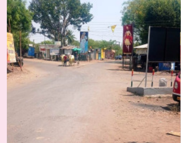
आटपाडी : बनपूरी : बनपूरीच्या मुख्य चौकातून बनपूरीत बस थांब्याची, प्रसाधनगृहाची सोय करण्याची मागणी होत आहे.

नितांत गरज आहे. या चौकातच महिला व पुरुष यांच्यासाठी सुलभ प्रसाधन गृहांची या बस थांब्याला जोडूनच सोय केली जाणे अति गरजेचे आहे. या सुलभूत गरजे ठरू पाहणाऱ्या या मागणीकडे प्रशासनाने तातडीने लक्ष द्यावे आणि ही जनहिताची मागणी सत्वर वास्तवात आणवी, लोकसभा/विधानसभा निवडणूका डोळ्यासमोर ठेवून कोट्यावधी रुपयांच्या विकास कामांना मंजुरी, भूमीपुजनांचा धुमधडाका सर्वत्र सुरू आहे. बनपूरीतल्या या अत्यावश्यक मागणीवर निधी मंजूर केल्याचा केवळ फार्स न होता, हे काम सत्वर