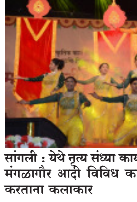
सांगली : येथे नृत्य संध्या कार्यक्रमांतर्गत भरतनाट्यम, कथक, मंगळागौर आदी विविध कार्यक्रमांमधून लोककलेचा जागर करतांना कलाकार

माणदेश एक्सप्रेस न्यूज सांगली : महाराष्ट्र राज्य सांस्कृतिक कार्य विभाग व सांस्कृतिक कार्य संचालनालय मुंबई व सांगली जिल्हा प्रशासन यांच्यावतीने कल्पद्रुम मैदान नेमिनाथनगर सांगली येथे २ ते ६ मार्च पर्यंत आयोजित महासंस्कृती महोत्सवाच्या आज चौथ्या दिवशी सायंकाळी नृत्य संध्या व गुठी महाराष्ट्राची मधून नृत्याचा सांस्कृतिक जागर केला गेला.