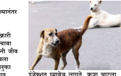
इजेक्सन घ्यावेच लागते. कुत्रा चाटला असेल, दात लागला नसेल, जखमांचे फक्त ब्रण असेल तर केवळ न्ही रेबीजचे इजेक्सन घ्यावे लागते.

नागाळा पार्कातील युवतीचा श्वान दंश झाल्यानंतर रेबीजने मृत्यू झाल्यांनंतर भटक्या कुत्र्यांचा आणि श्वान दंशावरील उपचाराचा विषय ऐरणीवर आला आहे. शहरातील सर्व भागात भटक्या कुत्र्यांचा उपद्रव वाढला आहे. कुत्र्याने चाबा घेतल्यांनंतर चोवीस तासांच्या आत न्ही रेबीजचे