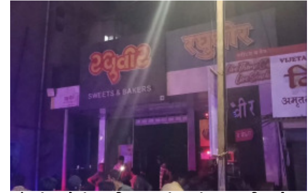
सांगली : येथील प्रसिद्ध रघुवीर स्वीटस या मिठाईच्या दुकानाला आग लागून यामध्ये यामध्ये लाखो रुपयांचे नुकसान झाले.

शहरातील विश्रामबाग येथे रघुवीर स्वीटस हे