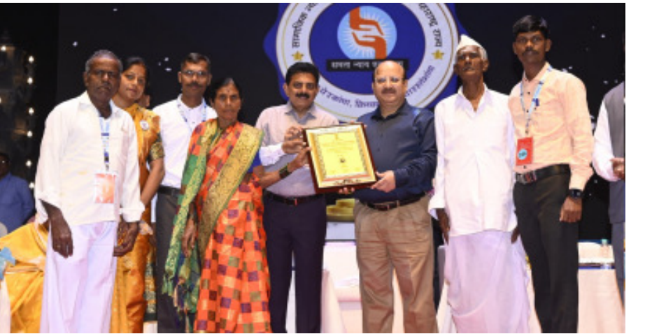
मुंबई : येथे मान्यवरांच्या हस्ते पुरस्कार स्वीकारताना सेवाभावी संस्थेचे पदाधिकारी

माणदेश एक्सप्रेस न्युज म्हसवड/प्रतिनिधी : सहाय्यक सेवाभावी संस्था खटाव ता. मिरज, जि. सांगली या संस्थेने सामाजिक बांधिलकी स्वीकारून २००५ पासून समाजातील लोकांचे जीवनमान उंचावण्यासाठी, स्त्रियांना समाजामध्ये मान सन्मान मिळण्यासाठी, तरुण पिढी व्यसनमुक्त राहण्यासाठी, मागास व दुर्बल घटक यांना एकत्रित करून त्यांचे जीवनमान उंचावण्यासाठी काम केले आहे.