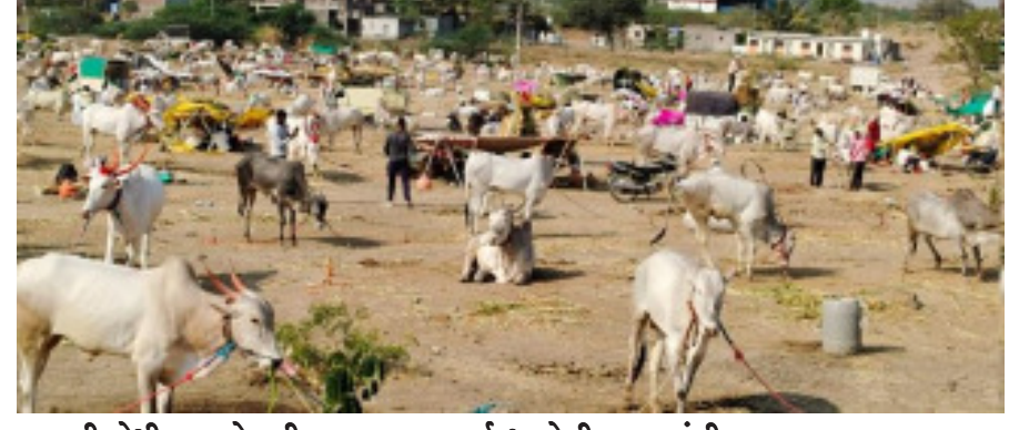
करगणी येथील बाळेवाडी रस्त्याच्या दुतर्फा भरलेली जनावरांची यात्रा