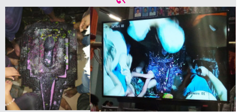
१) भुयारात वर्षभर बंद असणारे स्वयंभू शिवलिंग २) भुयारात न उतरता येणाऱ्यांना मोठ्या स्क्रीनवर भुयारातील स्वयंभू शिवलिंगाच्या दर्शनाचा मनसोक्त आनंद घेतला

दरम्यान, चालू वर्षी या भुयारात एक सी.सी.टी.व्ही. कॅमेरा बसवून हत्ती मंडपातील मोठ्या स्क्रीनवर भुयारातील स्वयंभू शिवलिंगाचे दर्शनाचा लाभ हृदय विकार, शुगर, अपंग, ऑपरेशन झालेले, दहा वर्षांच्या आतील मुले, गरोदर महिला तसेच ज्यांना दम्याचा आजार आहे आणि वयोवृद्ध महिला,पुरूष अशा तमाम