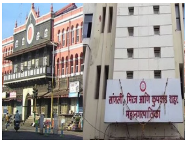
जानेवारीच्या रँकिंगमध्ये कोल्हापूर, सांगली महापालिका अग्रेसर ठरल्या आहेत. शेवटच्या पाच क्रमांकांमध्ये वसई-विरार (२३.०१), धुळे (२१), छत्रपती संभाजीनगर (२०.८८), परभणी (२०.८८) आणि जळगाव १८.८३) या महापालिकांचा समावेश आहे. त्यांच्या कामात महत्वपूर्ण सुधारणा होणे गरजेचे

माणदेश एक्सप्रेस न्युज सांगली : आरोग्यविषयक कार्यक्रमांच्या रँकिंगमध्ये सांगली, मिरज, कुणवाड महापालिका राज्यात पहिल्या पाच क्रमांकांमध्ये आली आहे. जानेवारी महिन्यातील रँकिंग गुरुवारी (दि. ७) राज्याच्या आरोग्य विभागाने जाहीर केले. पहिल्या क्रमांकावर पुणे महापालिका (३८.२९ गुण) आहे. दुसऱ्या क्रमांकावर कोल्हापूर (३७.४३), तिसऱ्या क्रमांकावर सांगली (३६.०९), चौथ्या क्रमांकावर नागपूर (३३.५०) आणि पाचव्या क्रमांकावर नवी मुंबई महापालिका (३३.११) आहे. राज्यातील सर्व महापालिकांमध्ये आरोग्यविषयक कार्यक्रम राबविण्याच्या गतीवरून प्रत्येक महिन्याचा गुणानुक्रम काढला जातो.