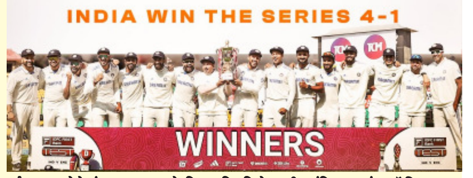
INDIA WIN THE SERIES 4-1