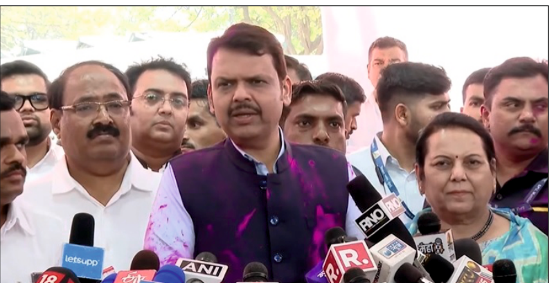
मुंबई : विधिमंडळाच्या अधिवेशनाचे कामकाज संपल्यानंतर श्री फडणवीस यांनी पत्रकारांशी संवाद साधताना

माणदेश एक्सप्रेस न्युज मुंबई : राज्य शासनाने मराठा आरक्षणासंदर्भात बोलविलेल्या विशेष अधिवेशनात मराठा समाजाला सामाजिक व शैक्षणिक मागास प्रवर्गात शिक्षण व नोकरीमध्ये १० टक्के आरक्षण देण्याचे विधेयक एकमताने मंजूर झाले. त्यामुळे मराठा समाजाला आरक्षण मिळण्याचा मार्ग मोकळा झाला आहे. राज्य शासनाच्या या निर्णयामुळे वर्षानुवर्षे एकाच गावात नांदणारे मराठा व ओबीसी बांधव यापुढेही गुण्यागोविंदाने नांदतील व दोन्ही समाजाचा विकास होईल, असे प्रतिपादन उपमुख्यमंत्री देवेंद्र फडणवीस यांनी विधानभवन परिसरात पत्रकारांशी बोलताना केले. विधिमंडळाच्या अधिवेशनाचे कामकाज संपल्यानंतर श्री. फडणवीस यांनी पत्रकारांशी संवाद साधला. त्यावेळी ते म्हणाले की, मुख्यमंत्री एकनाथ शिंदे यांच्या नेतृत्वाखाली राज्य सरकारने मराठा समाजाला १० टक्के आरक्षण देण्याचे विधेयक दोन्ही सभागृहात मांडले. दोन्ही सभागृहात हे विधेयक एकमताने मंजूर करण्यात आले आहे.