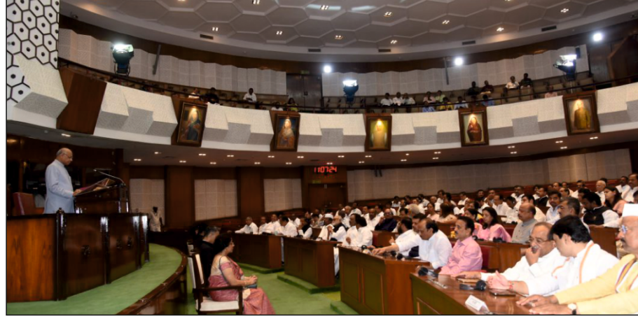
मुंबई : विधीमंडळ अधिवेशनाची सुरुवात संयुक्त सभागृहात राज्यपाल रमेश बैस अभिभाषण करताना