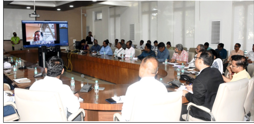
पुणे : विधानभवन पुणे येथे आयोजित महारोजगार मेळाव्याच्या आढावा बैठकीत दूरदृष्यप्रणालीद्वारे मंत्री श्री. लोढा यांनी मार्गदर्शन केले. यावेळी बैठकीला उपस्थित अधिकारी

पुणे : शासनाच्या कौशल्य, विकास, उद्योजकता व नाविन्यता विभागाच्यावतीने पुणे विभागस्तरीय नमो महारोजगार मेळावा २ मार्च २०२४ रोजी बारांमती येथे आयोजित करण्यात आला असून औद्योगिक आस्थापनांकडून रिक्त पदांची नोंदणी केली जाईल आणि त्या माध्यमातून अधिकाधिक युवकांना रोजगार मिळवून देता येईल यासाठी सूक्ष्म नियोजन करा, अशा सूचना कौशल्य विकास मंत्री मंगल प्रभात लोढा यांनी दिल्या.