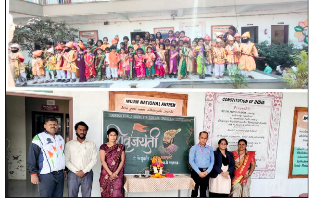
सांगोला : येथे फॅबटेक पब्लिक स्कूलमध्ये शिवजन्मोत्सव उत्साहात संपन्न झाली. यावेळी विद्यार्थ्यांनी छत्रपती शिवाजी महाराजांची राजमाता जिजाऊ तसेच मावळे यांची वेशभूषा धारण केली होती.