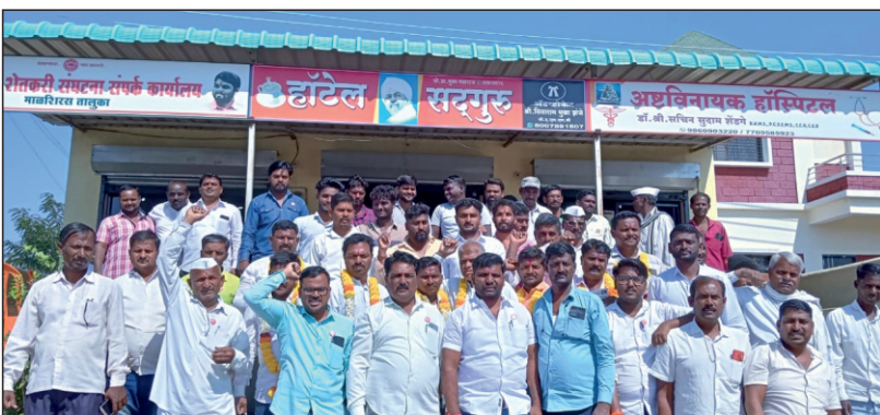
माळशिरस : स्वाभिमानी शेतकरी संघटनेच्या पदाधिकाऱ्यांची बैठक संपन्न झाली. यावेळी बैठकीस उपस्थित संघटनेचे पदाधिकारी व कार्यकर्ते

पिलीव/वार्ताहर : स्वभिमानी शेतकरी संघटनेची माळशिरस तालुक्यातील नूतन पदाधिकारी निवडी व आगामी लोकसभा निवडणुकीच्या पार्श्वभूमीवर माळशिरस तालुक्यातील प्रमुख पदाधिकाऱ्यांची तातडीची बैठक संपन्न झाली. या बैठकीत संघटनात्मक बांधणी व बूथ बांधणी याचा आढावा घेण्यात आला व त्या अनुषंगाने जबाबदाऱ्यांचे वाटपही करण्यात आले. ताकदीने स्वबळावर या निवडणुकीला सामोरे जाण्याचा निर्णय या बैठकीत सर्वांनी घेतला.कोणत्याही क्षणी दूध दर वाढ आंदोलन गनिमी काव्याने होणार आहे, त्यादृष्टीने देखील रणनीती यावेळी आखण्यात आली. निवडणुकीच्या कामात आंदोलनाकडे दुर्लक्ष होता कामा नये, हेही निश्चून