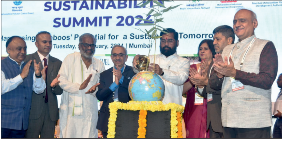
मुंबई : पर्यावरणीय शाश्वतता शिखर परिषदेचे उद्घाटन करताना एकनाथ शिंदे व उपस्थित मान्यवर