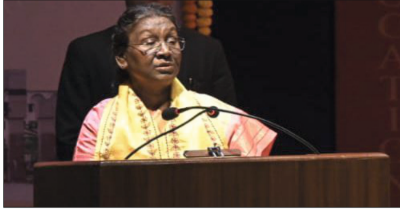
नागपूर : राष्ट्रसंत तुकडोजी महाराज नागपूर विद्यापीठाच्या १११ व्या दीक्षान्त समारंभ कार्यक्रमात बोलताना राष्ट्रपती द्रौपदी मुर्मू