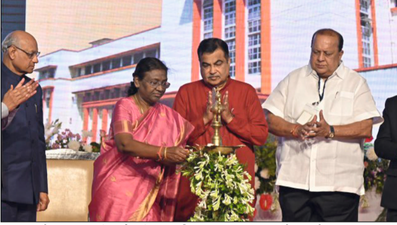
नागपूर : येथील शासकीय वैद्यकीय महाविद्यालयाच्या अमृत महोत्सवाचे उद्घाटन राष्ट्रपती द्रौपदी मुर्मू, राज्यपाल रमेश बैस, मंत्री नितीन गडकरी, देवेंद्र फडणवीस, हसन मुश्रीफ व मान्यवर