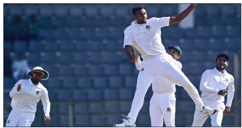
न्यूझीलंडच्या खेळाडूला बाद केल्यावर आनंद व्यक्त करताना बांगलादेशचे खेळाडू

माणदेश एक्सप्रेस न्युज नवी दिल्ली : तैजुल इस्लामच्या (१० विकेट्स) घातक फिरकी गोलंदाजीच्या जोरावर बांगलादेशने सिल्व्हेट येथे खेळल्या गेलेल्या पहिल्या कसोटीत न्यूझीलंडचा १५० धावांनी पराभव केला. बांगलादेशने न्यूझीलंडला विजयासाठी ३३२ धावांचे लक्ष्य दिले होते. प्रत्युत्तरात पाहणा किवींचा संघ केवळ १८१ धावांवरच गारद झाला. या विजयासह बांगलादेशने २ सामन्यांच्या कसोटी मालिकेत १-० अशी आघाडी घेतली आहे. चौथ्या दिवसाचा खेळ संपेपर्यंत न्यूझीलंडने ४९ षटकांत ७ गडी गमावून ११३ धावा केल्या होत्या. शेवटच्या दिवशी न्यूझीलंडला विजयासाठी २१८ धावांची तर बांगलादेशला विजयासाठी ३ विकेट्सची गरज होती. पाचव्या दिवशी किवींनी पुढे खेळण्यास सुरुवात केली तेव्हा मैदानावर डॅरिल मिशेल आणि इश सोधी होते. या दोघांवर