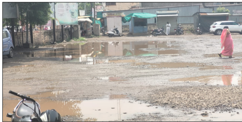
आटपाडी : बस स्थानक येथे पावसाच्या पाण्याने बस स्थानकामध्ये साचलेले पाण्याचे तळे

माणदेश एक्सप्रेस न्युज आटपाडी/प्रतिनिधी : आटपाडी तालुका कायमस्वरूपी दुष्काळी तालुका म्हणून गणला जातो. याठिकाणी पर्जन्यमाना पेक्षा कमी पाऊस पडतो. त्यामुळे याचा फायदा या भागामध्ये काम करणारे सरकारी ठेकेदार घेत असल्याने निकृष्ट दर्जाची कामे होत आहेत. याचाच प्रत्यय आटपाडी बस स्थानक येथे पहावयास मिळत असून बस स्थानकात रस्ता कमी अन खड्डे जाता अशी परिस्थिती निर्माण झाली आहे. बस स्थानकात ये-जा करणाऱ्या प्रवाशांना खड्यातील पाण्यातून प्रवास करावा लागला. खड्यातून बस स्थानकात गेल्यावर मात्र प्रवाशांना 'तीर मारून आल्याचा' भास होत होता.