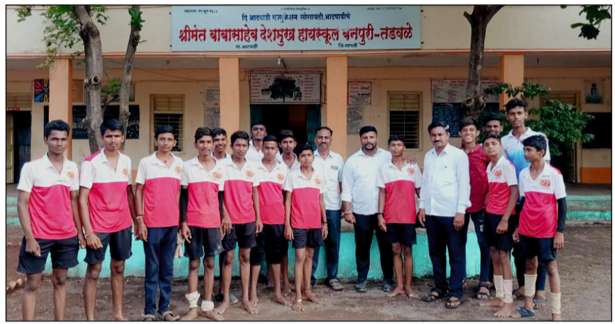
आटपाडी : जिल्हास्तरीय खो-खो-स्पर्धेसाठी निवड झालेला देशमुख महाविद्यालयाचा संघ

माणदेश एक्सप्रेस न्युज आटपाडी/प्रतिनिधी : आटपाडी तालुकास्तरीय खो-खो स्पर्धेत श्रीमंत बाबासाहेब देशमुख महाविद्यालय आटपाडी चा मुलांनी दणदणीत विजय संपादन केला. या विजयामुळे जिल्हास्तरीय स्पर्धेसाठी संघाची निवड झाली. श्रीमंत बाबासाहेब देशमुख हायस्कूल बनपुरी-तडवळे या ठिकाणी तालुकास्तरीय खो-खो स्पर्धेचे आयोजन करण्यात आले होते. यामध्ये १९ वर्ष वयोगटातील खो-खो संघातील खेळाडूंनी प्रतिस्पर्ध्यांसंघावरती मात करून प्रथम