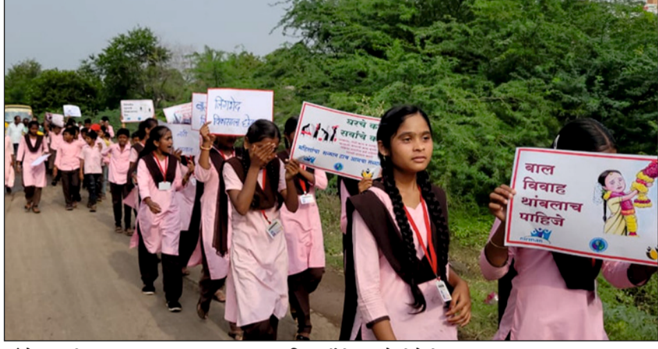
सांगोला : स्त्री पुरुष समानता बाबत हायस्कूलच्या विद्यार्थींनी काढलेली फेरी

निर्माण संस्था पुणे आणि मैत्री नेटवर्क च्या सहकार्याने डॉ. आंबेडकर शेती विकास व संशोधन संस्था स्त्री पुरुष समानता आणि हिंसामुक्त समाज निर्मितीसाठी समाजातील विविध गटा सोबत काम करत आहे. किशोरवयीन मुले, महिला-पुरुष, तसेच गाव पातळीवरील विविध संस्था संघटना यांना घेऊन हे अभियान राबवले जात आहे. या अभियानाच्या माध्यमातून विविध जाणीव जागृती कार्यक्रम, चित्रपट, सद्यांची मोहीम, पोस्टर प्रदर्शन, शालेय मुलांच्या गावातून जाणीव जागृती फेरी, खेळ आणि चित्रकला स्पर्धा आदी कार्यक्रम राबवले जात आहेत. सांगोला तालुक्यातील सोनंद, डोंगरगाव, मानेगाव, निजामपूर, घेरडी, एखतपूर, लोनबिरे, हातीद या गावात विविध घटकांसोबत वरील कार्यक्रम राबवले जात असून या कार्यक्रमाच्या