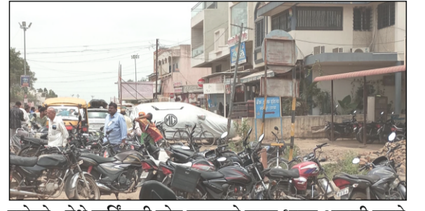
नातेपुते : येथे पार्किंगची सोय नसल्याने वाहन धारक आपली वाहने कुठेही अस्ताव्यस्त लावत असल्याने वाहतुकीची कोंडी होत आहे.

माणदेश एक्सप्रेस न्युज नातेपुते/राजेंद्र पिसे : नातेपुते शहरात दुचाकी, चारचाकी वाहनांची संख्या दिवसेंदिवस झपाट्याने वाढत आहे. वाहने उभी करण्यासाठी पार्किंगची व्यवस्था नसल्यामुळे वाहतुकीला मोठा अडथळा निर्माण होत असल्याने, त्यामुळे अपघात होण्याची दाट शक्यता आहे. शहरातील मुख्य मार्गांलगत रोडवर वाहने उभी केली जातात. त्यामुळे वाहतुकीला अडथळा निर्माण होतो.शहरातील मुख्य भाग दहिगाव रोड, पुणे पंढरपूर रोड, नातेपुतेतील मेन बाजारपेठ परिसरात पार्किंगची व्यवस्था नसल्यामुळे वाहतुकीला मोठा अडथळा निर्माण होत आहे. या बाबीचा फटका रस्त्यावरून पायी चालणारे नागरिक, शाळेकरी विद्यार्थी, ज्येष्ठ