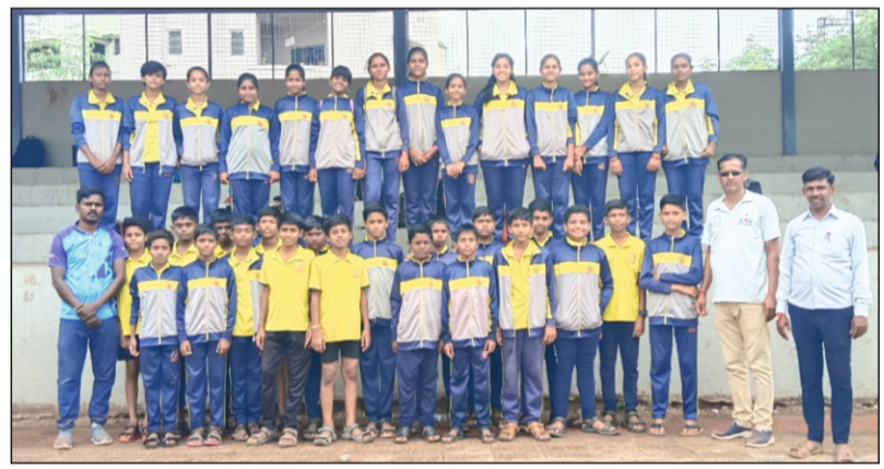
म्हसवड : जिल्हास्तरीय आटपाट्या खेळ स्पर्धेत यश मिळविलेला क्रांतिवीर नागनाथअण्णा नायकवाडी शाळेचे मुले व मुलींचा संघ

माणदेश एक्सप्रेस न्युज म्हसवड/अहमद मुल्ला : जिल्हास्तरीय आटपाट्या खेळ स्पर्धेत क्रांतिवीर शैक्षणिक संकुला अंतर्गतच्या क्रांतिवीर नागनाथअण्णा नायकवाडी शाळा म्हसवड च्या खेळाडूंनी दुहेरी यश संपादन केले. जिल्हास्तरीय आटपाट्या स्पर्धा नुकत्याच दहिवडी येथे संपन्न झाल्या. जिल्हा क्रीडा अधिकारी सातारा व महात्मा गांधी विद्यालय आणि ज्युनियर कॉलेज दहिवडी यांच्या संयुक्त विद्यमाने जिल्हास्तरीय १४ वर्ष वयोगटा खालील मुले व मुली यांच्या आटपाट्या खेळ स्पर्धेचे आयोजन केले होते.या स्पर्धेत माण तालुक्यातील शाळा व विद्यालयाचे १६ संघ सहभागी झाले होते.