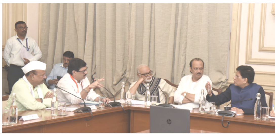
मुंबई : नाशिक जिल्ह्यातील कांदा व्यापाऱ्यांनी पुकारलेल्या बंदच्या पार्श्वभूमीवर मंत्रालयात केंद्रीय मंत्री पीयूष गोयल यांच्या उपस्थित बैठक संपन्न झाली. बैठकीस उपस्थित मान्यवर

माणदेश एक्सप्रेस न्युज मुंबई : कांदा उत्पादक शेतकऱ्यांना दिलासा देण्यासाठी कृषी उत्पन्न बाजार समिती आवारात नाफेड आणि 'एनसीसीएफ' यांनी थेट शेतकऱ्यांकडून कांदा खरेदी करावी, अशी लोकप्रतिनिधींनी मागणी केली आहे. यासंदर्भात निर्णय घेण्यासाठी दिल्ली येथे २९ सप्टेंबरला बैठक घेऊन योग्य तो निर्णय घेण्यात येईल, अशी माहिती केंद्रीय वाणिज्य मंत्री पीयूष गोयल यांनी दिली. दिल्ली येथील बैठकीस राज्य मंत्रिमंडळ सदस्यांचे शिष्टमंडळ उपस्थित राहील, अशी माहिती उपमुख्यमंत्री अजित पवार यांनी दिली. कांदा उत्पादक शेतकरी, व्यापाऱ्यांसह ग्राहक वर्गाच्याही हिताचे रक्षण करण्याचा राज्य शासनाचा सर्वतोपरी प्रयत्न आहे. त्यामुळे कांदा उत्पादक शेतकरी आणि ग्राहकांची गैरसोय टाळण्यासाठी नाशिक जिल्ह्यातील व्यापाऱ्यांनी लिलाव बंदीचा निर्णय मागे घेऊन तातडीने कांदा खरेदी सुरू करावी, असे आवाहन केंद्रीय मंत्री पीयूष गोयल, उपमुख्यमंत्री श्री. पवार यांच्यासह उपस्थित मंत्रिमहोदयांनी केले. नाशिक जिल्ह्यातील कांदा व्यापाऱ्यांनी पुकारलेल्या बंदच्या पार्श्वभूमीवर कांदा उत्पादक शेतकऱ्यांसह व्यापाऱ्यांच्या हिताचे रक्षण करण्यासंदर्भात केंद्रीय मंत्री श्री. गोयल व उपमुख्यमंत्री श्री. पवार यांच्या उपस्थितीत मुंबईतील सहाद्री