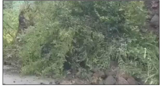
महाबळेश्वर : वाई-पाचगणी रस्त्यावर पसरणी घाटात कोसळलेली दरड

माणदेश एक्सप्रेस न्युज वाई : वाई पाचगणी रस्त्यावर पसरणी घाटात बुधवारी दुपारी दरड कोसळली. यामुळे पाचगणी महाबळेश्वरकडे जाणारी येणारी वाहतूक ठप्प झाली.पसरणी घाटात वाहनांच्या मोठ्या रांगा लागल्या होत्या. सार्वजनिक बांधकाम विभागाने तातडीने दरड हटविण्याचे काम सुरू केले.