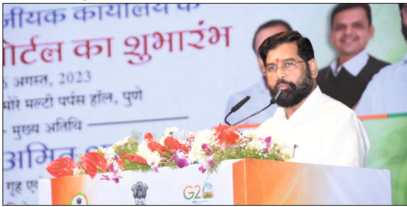
पुणे : येथे केंद्रीय सहकारी संस्था निबंधक कार्यालयाच्या डिजीटल पोर्टलच्या उद्घाटन कार्यक्रमात बोलताना, मुख्यमंत्री एकनाथ शिंदे

पुणे : महाराष्ट्राच्या विकासात सहकार क्षेत्राचे मोठे योगदान आहे, विशेषतः पश्चिम महाराष्ट्राच्या विकासात सहकार क्षेत्राचे योगदान मोठे आहे. राज्यात २ लाख २० हजार सहकारी संस्था असून ६०० पेक्षा अधिक बहुराज्य संस्था आणि सोसायट्या कार्यरत आहेत. केंद्र शासनाचे नवे पोर्टल सहकार क्षेत्राच्या विकासासाठी मैलाचा दगड ठरले असे प्रतिपादन राज्याचे मुख्यमंत्री एकनाथ शिंदे यांनी केले. केंद्रीय सहकारी संस्था निबंधक कार्यालयाच्या डिजीटल पोर्टलच्या उद्घाटन कार्यक्रमात ते बोलत होते. पुढे बोलताना ते म्हणाले, केंद्राच्या सहकार विभागाने अनेक महत्वाचे निर्णय घेतले आहेत. केंद्र सरकार सहकार क्षेत्राच्या विकासाकडे अत्यंत सकारात्मकतेने लक्ष देत आहे. नव्या पोर्टलमुळे नोंदणीची स्थिती, नोंदणी, आदेश, सोसायटीचे प्रमाणपत्र, विवरण सामान्य शेतकऱ्यांना उपलब्ध होतील. राज्यात सहकारी संस्थांमध्ये ५ कोटी २८ लाख सदस्य आहेत. सहकारी बँकेमधील ठेवी २ लाख ३१ हजार कोटीपेक्षा जास्त आणि खेळते भांडवल साडेचार लाख कोटीपेक्षा जास्त आहेत. या चळवळींचा