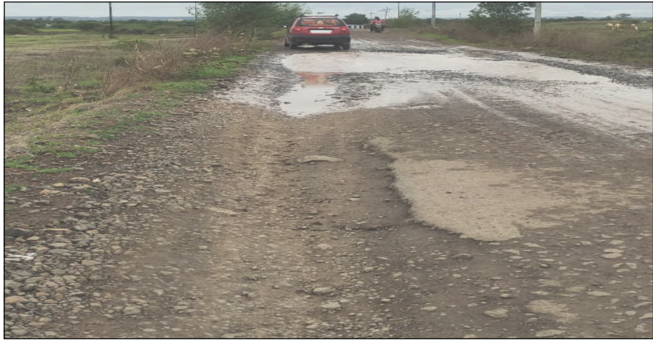
म्हसवड : म्हसवड-पुळकोटी रस्त्यावर पडलेल्या खड्ड्यांमुळे वाहनधारकांना मोठा त्रास सहन करावा लागत असून छोटे-मोठे अपघात होत आहेत