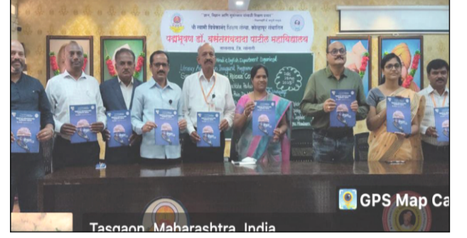
तासगाव : 'संस्कार' अंक प्रकाशन सोहळ्यानिमित्त उपस्थित मान्यवर