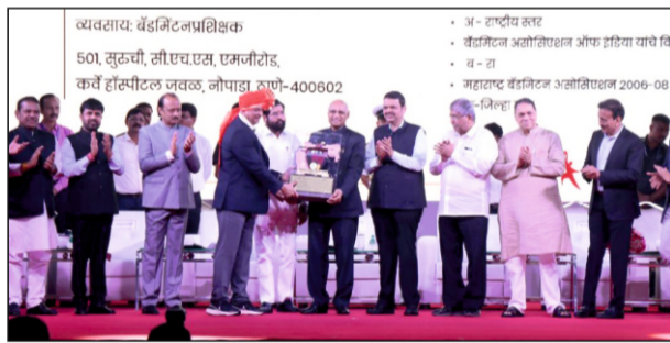
पुणे : विजेत्यांना क्रीडा पुरस्कार प्रदान करताना राज्यपाल रमेश बैस