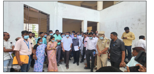
जत : मंत्री अतुल सावे यांनी उमदी घटनेतील विद्यार्थ्यांना धीर देत त्यांच्या नातेवाईकांची चौकशी केली.

माणदेश एक्सप्रेस न्युज सांगली : उमदी गावामध्ये असलेल्या समता अनुदानित आश्रमशाळेमधील विद्यार्थ्यांना काल दि. २७ ऑगस्ट रोजी रात्री जेवणानंतर अन्नातून विषबाधा झाल्याची लक्षणे दिसून आल्यानंतर या विद्यार्थ्यांना जत, माडग्याळ, कवठेमहाकाळ व मिरज शासकीय वैद्यकीय महाविद्यालय व रूग्णालयात दाखल करण्यात आले. याची दखल घेत गृहनिर्माण व इतर मागास बहुजन कल्याण मंत्री अतुल सावे यांनी ग्रामीण रूग्णालय जत येथे भेट देवून या घटनेची सविस्तर माहिती घेतली. जत रूग्णालयात उपचारासाठी दाखल करण्यात आलेल्या विद्यार्थ्यांची आस्थेवाईकपणे विचारपूस करून विद्यार्थी व त्यांच्या पालकांना धीर दिला. अन्नातून विषबाधा झालेल्या विद्यार्थ्यांवर