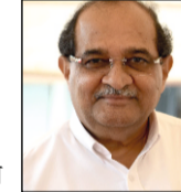
राधाकृष्ण विखे पाटील

माणदेश एक्सप्रेस न्युज मुंबई : राज्यातील गोवंशीय पशुधनामध्ये विषाणूजन्य व संसर्गजन्य लम्पी चर्मरोगाचा प्रादुर्भाव झाला आहे. या रोगाचा प्रादुर्भाव नियंत्रणात आणण्यासाठी राज्यात लम्पी चर्मरोग प्रतिबंधात्मक लसीकरण ७३ टक्के करण्यात आले आहे. उर्वरित लसीकरण ७ दिवसांत पूर्ण करण्याच्या सूचना सर्व संबंधित यंत्रणेला देण्यात आल्या आहेत. लसीकरण करून घेण्याची जबाबदारी जिल्हा परिषदेचे मुख्य कार्यकारी अधिकारी यांची राहिल, असे पशुसंवर्धन व दुग्ध व्यवसाय मंत्री राधाकृष्ण विखे पाटील यांनी