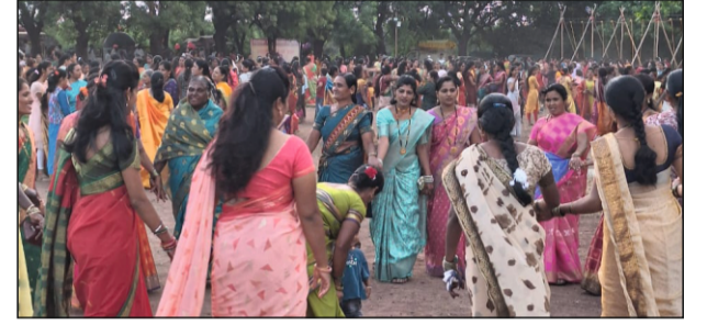
नातेपुते : येथे नागपंचमी सण महिलांनी एकत्र येवून साजरा केला.

माणदेश एक्सप्रेस न्युज नातेपुते/वार्ताहर : अधिवासाचे प्रतीक, शेतकऱ्यांचा मित्र आणि निसर्ग साखळीत महत्त्वाचा घटक असलेल्या नागांबद्दल कृतज्ञता व्यक्त करून नातेपुते शहरात सोमवारी नागपंचमी उत्साहात संपन्न झाली. नागपंचमी हा श्रावणातील महत्त्वाचा सण. यावेळी सोमवारी नागपंचमी आल्याने महिलांनी नातेपुते येथील शंभू महादेवाचे दर्शन घेऊन पर्वतेश्वर मंदिराजवळ नागदेवतेची पूजा केली. महिला, मुली तसेच नवविवाहिता यासाठी हा सण