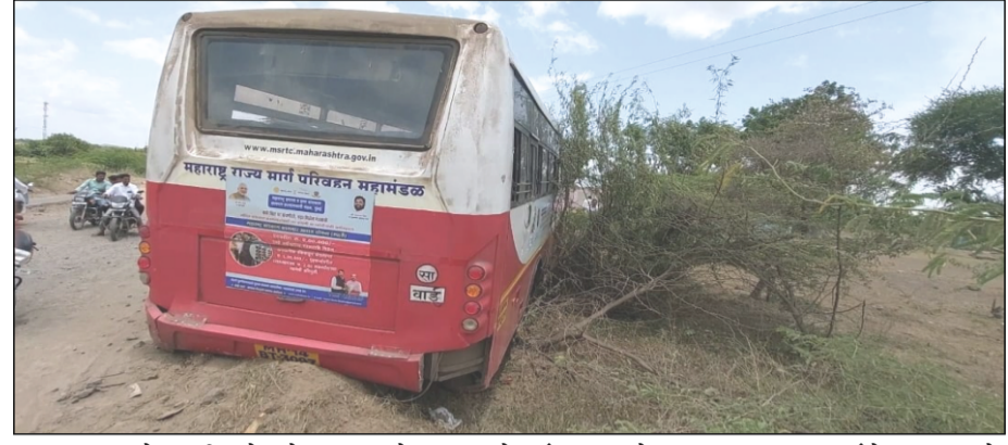
म्हसवड : धुळदेव नजीक ब्रेक फेल झाल्याने, चालकाने प्रसंगावधानाने झाडावर घालत प्रवाशांचे प्राण वाचले

माणदेश एक्सप्रेस न्युज म्हसवड/प्रतिनिधी : वाई आगारातील वाई-लातूर एस.टी.बस.आज म्हसवड मार्गे जात असताना, धुळदेव ता. माण येथे ब्रेक फेल झाले. परंतु एस.टी. वाहन चालकाच्या प्रसंगावधाने वाचले अनेक प्रवाशांचे प्राण वाचले. याबाबत अधिक माहिती अशी, आज सकाळी वाई आगारातून म्हसवड-पंढरपूर मार्गे लातूर जात असलेली एम.एच.१४ बि.टी. ३०९७ एस.टी.बस म्हसवड येथून लातूरकडे जात असताना धुळदेव नजीक दुपारी १२ वाजून ३० च्या दरम्यान बसचा ब्रेक