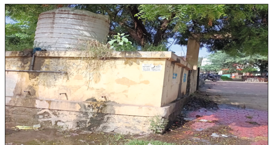
आटपाडी : येथील स्मशानभूमीमध्ये असलेल्या पाण्याच्या टाकीच्या गळतीमुळे परिसर चिखलमय होत आहे.

नगरपंचायतीचे दुर्लक्ष : परिसरात घाणीचे साम्राज्य