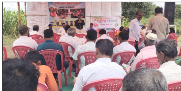
आटपाडी : येथे अलर्ट बायोटेक नाशिक व स्वराज कृषी सेवा केंद्र यांच्यावतीने शेतकरी मेळावा संपन्न झाला.