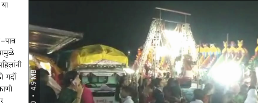
आटपाडी : नागपंचमी यात्रा उत्साहात मोठ्या उत्साहात संपन्न झाली. यावेळी यात्रेला भाविकांनी मोठी गर्दी केली होती.