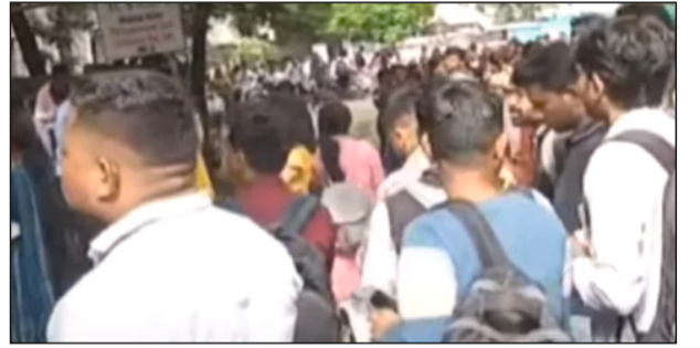
अकोला : तलाठी भरती परीक्षेमध्ये सर्व्हर डाऊन झाल्याने विद्यार्थ्यांना ताटकळत बसावे लागले.

माणदेश एक्सप्रेस न्युज आटपाडी : राज्यामध्ये सुरु असलेल्या तलाठी भरती परीक्षेमध्ये सर्व्हर डाऊन झाला असून विद्यार्थ्यांचे मोठे हाल झाले असून यामुळे विद्यार्थी संतप्त झाले आहेत. संभाजीनगर, अकोला, अमरावती आणि नागपूर या जिल्ह्यात परीक्षाआधीच सर्व्हर डाऊन झाल्याचा प्रकार समोर आला आहे. यामुळे हजारो विद्यार्थ्यांचा खोळंबा झाल्याचे पाहायला मिळाले. अकोला जिल्ह्यातस बाभूळगाव आणि कापशी येथील परीक्षा केंद्रावर हजारो विद्यार्थी परीक्षा देणार आहेत. या परीक्षेसाठी सकाळी ९ ते ११ ही परीक्षेची वेळ होती. मात्र अचानक सर्व्हर डाऊन झाल्याने विद्यार्थ्यांची नोंदणी बंद पडली. त्यामुळे विद्यार्थ्यांना परीक्षेची वेळ होऊन देखील परीक्षा केंद्राबाहेरच थांबवे लागत आहे. नागपूरमध्ये देखील असाच प्रकार समोर आला