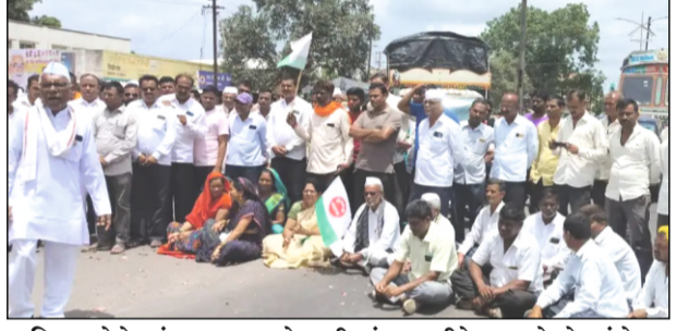
नाशिक : येथे कांदा उत्पादक शेतकरी यांच्या वतीने रास्ता रोको आंदोलन करताना शेतकरी