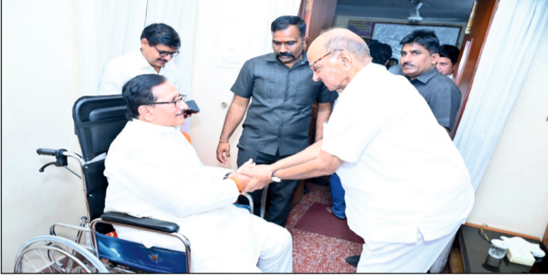
अकलूज : येथे माजी उपमुख्यमंत्री विजयसिंह मोहिते पाटील यांच्या बंगल्यावर जाऊन त्यांच्या प्रकृतीची विचारपूस करताना शरद पवार

माळशिरस : राष्ट्रवादी काँग्रेसचे अध्यक्ष शरद पवार यांनी रविवारी अकलूज येथील शिवरत्न बंगल्यावर जाऊन माजी उपमुख्यमंत्री विजयसिंह मोहिते पाटील यांच्या प्रकृतीची विचारपूस केली. तब्बल चार वर्षांनंतर पवार हे 'शिवरत्न' बंगल्यावर आले होते. विजयदादा हे व्हिलचेअरवर कार्यक्रमाला आले होते. पवार यांनी व्यासपीठावरच विजयसिंह मोहिते पाटील यांची विचारपूस केली होती. त्यावेळी त्यांना विजयदादा हे आजारी असल्याचे समजले. कार्यक्रम संपल्यानंतर आपण अकलूजला जाऊन मोहिते पाटील यांच्या प्रकृतीची विचारपूस करणार असल्याचे पवार