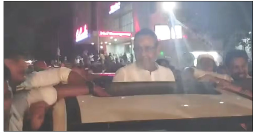
मुंबई : रुग्णालयातून बाहेर पडताच कार्यकर्त्यांकडून नवाब मलिक यांचे जंगी स्वागत करण्यात आले.

मुंबई : माजी मंत्री व राष्ट्रवादी काँग्रेसचे नेते नवाब मलिक यांना सर्वोच्च न्यायालयाने दोन महिन्यांचा अंतरिम जामीन दिला आहे. जामीन मिळाल्यानंतर अखेर ते क्रिटी केअर रुग्णालयातून बाहेर पडले. नवाब मलिक यांच्या स्वागतासाठी राष्ट्रवादीचे अनेक नेते आणि कार्यकर्ते जमा झाले होते. कार्यकर्त्यांनी नवाब मलिकचा जंगी स्वागत केलं आहे. सर्वोच्च न्यायालयाने नवाब मलिक यांना आरोग्याच्या कारणास्तव दोन महिन्यांचा अंतरिम जामीन दिला आहे. जामीन मिळाल्यानंतर सर्व कागदोपत्री प्रक्रिया पूर्ण केल्यानंतर नवाब मलिक रुग्णालयातून बाहेर पडले. आमदार